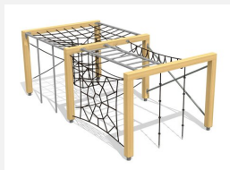
KL.150.2.20 Kletterquader Holz 2, Höhe 200 cm