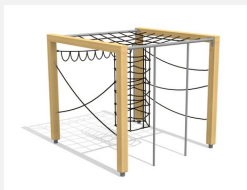
KL.150.1.25 Kletterquader Holz 1, Höhe 250 cm