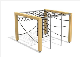
KL.150.1.20 Kletterquader Holz 1, Höhe 200 cm