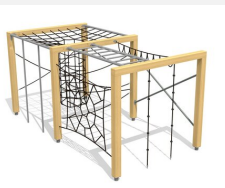
KL.150.2.25 Kletterquader Holz 2, Höhe 250 cm