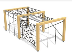
KL.150.2.20 Kletterquader Holz 2, Höhe 200 cm