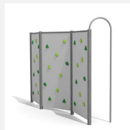
KL.080.3.M Kletterwand 3 - Metall