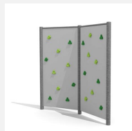
KL.080.2.M Kletterwand 2 - Metall