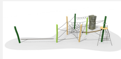
KL.008.4.L Fels-Seilgarten 4 - lasiert