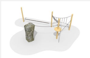
KL.008.2 Fels-Seilgarten 2