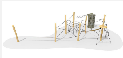
KL.008.4 Fels-Seilgarten 4