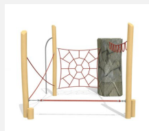
KL.006.3 Climber 3