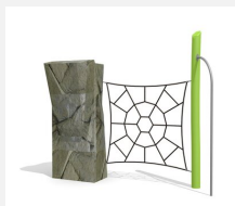
KL.006.1.L Climber 1 - lasiert