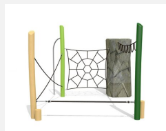
KL.006.3.L Climber 3 - lasiert