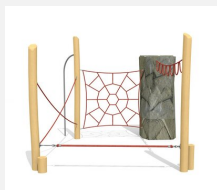
KL.006.3 Climber 3