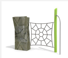
KL.006.1.L Climber 1 - lasiert