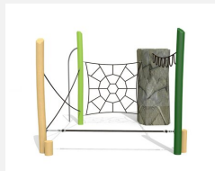
KL.006.3.L Climber 3 - lasiert