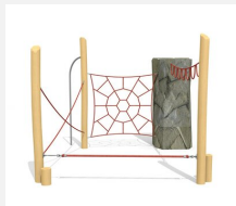
KL.006.3 Climber 3