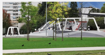
FS.050.22 EPDM Gummigranulat Fallschutzboden 220