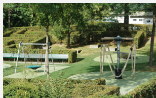
FS.050.15 EPDM Gummigranulat Fallschutzboden 150