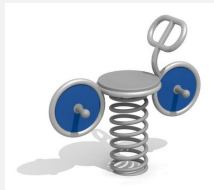
FG.090.405.B Motorrad - Edelstahl blau