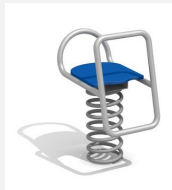
FG.090.401.B Rennschlitten - Edelstahl blau