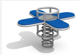
FG.090.431.B Kleeblatt - Edelstahl blau