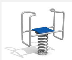
FG.090.450.B Stehwippe - Edelstahl blau