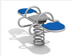
FG.090.430.B Doppelwippe - Edelstahl blau