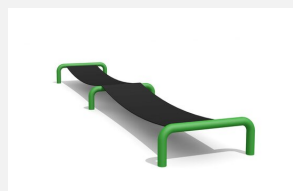
FA.080.C Gurtentrampolin color