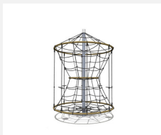
DR.060.2 Karussell M 150 - nature