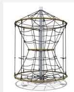
DR.061.2 Karussell L 220 - nature