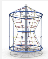
DR.061.2.C Karussell L 220 - color