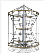
DR.061.2 Karussell L 220 - nature