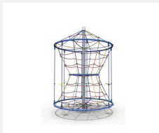
DR.060.2.C Karussell M 150 - color