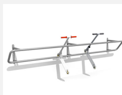
DI.030.35 Kickbar 1 Wand, 350 cm