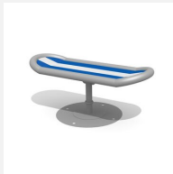
C111 Das Brett