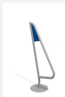
C315.20 Der Windsurfer