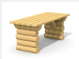
BT.031.T Tisch Legno