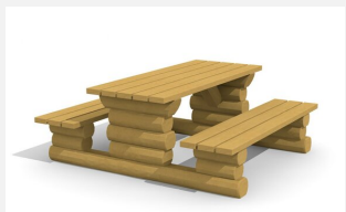
BT.031.TK.L Tischkombi Legno lasiert