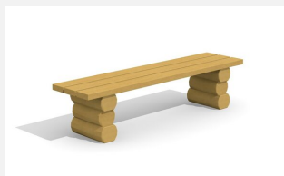
BT.031.H.L. Hockerbank Legno lasiert