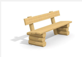
BT.031.B Bank Legno