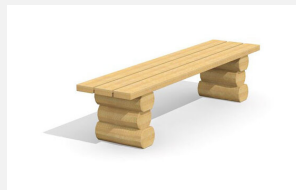
BT.031.H Hockerbank Legno