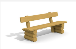
SOPR.021 Bank Legno lasiert - Ausstellungsmodell NEU