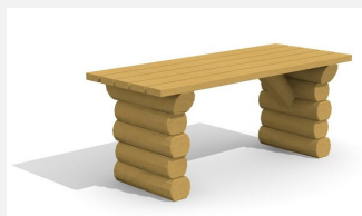
BT.031.T.L Tisch Legno lasiert