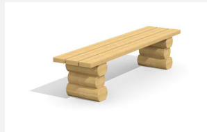
BT.031.H Hockerbank Legno