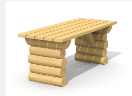
BT.031.T Tisch Legno