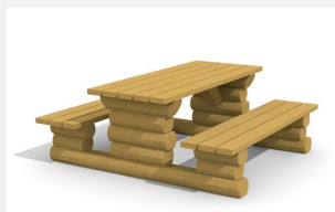
BT.031.TK.L Tischkombi Legno lasiert