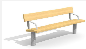
BT.021.BA Bank Sola mit Armlehne