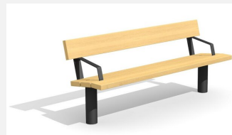
BT.021.BA.C Bank Sola mit Armlehne - color