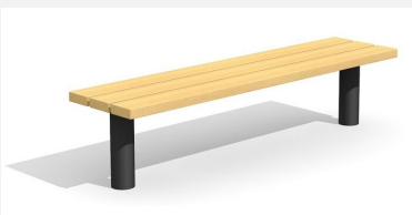
BT.021.H.C Hockerbank Sola - color