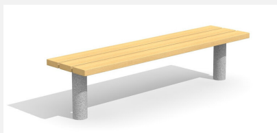
BT.021.H Hockerbank Sola