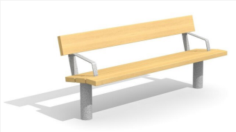
BT.021.BA Bank Sola mit Armlehne