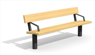
BT.021.BA.C Bank Sola mit Armlehne - color