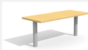
BT.021.T Tisch Sola