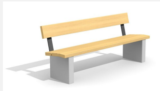
BT.020.B.C Bank Beta - color