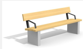
BT.020.BA.C Bank Beta mit Armlehne - color