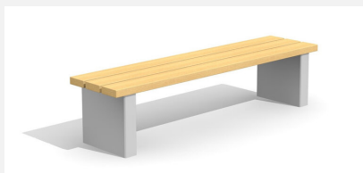
BT.020.H Hockerbank Beta