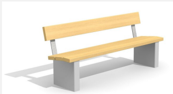
BT.020.B Bank Beta