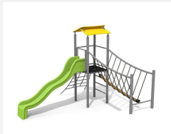
BS.100.1.M Kletterlandschaft 1 an Hügel steel