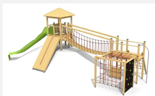
BM.060.2 Spielanlage Stans - Hügel