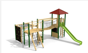
BM.060.1.L Spielanlage Stans - farbig lasiert