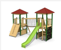
BM.050.1.L Spielanlage Ennetbürgen - farbig