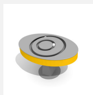
BA.242.507.1.3 Twist color