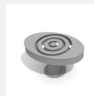
BA.242.507.3.3.I Hula Edelstahl