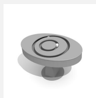
BA.242.507.1.3.I Twist Edelstahl