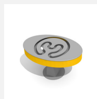
BA.242.507.2.3 Charleston color