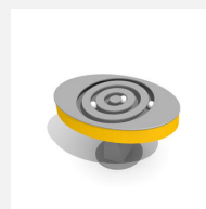
BA.242.507.3.3 Hula color