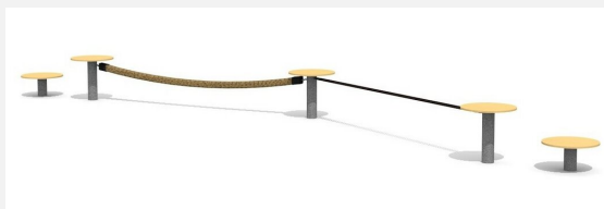
BA.052.2 bimbo Balancierschule 2 - Holz-Metall