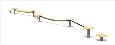
BA.052.4 bimbo Balancierschule 4 - Holz-Metall