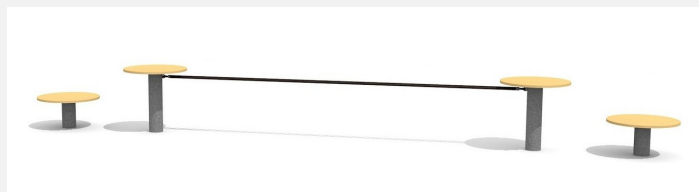
BA.052.1 bimbo Balancierschule 1 - Holz-Metall