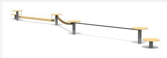
BA.052.3 bimbo Balancierschule 3 - Holz-Metall