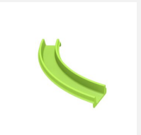
1.10.41.01 Kurve 67.5° links, 360 cm