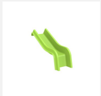
1.10.40.00 Auslauf 180 cm