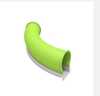
1.10.42.01 Überdeckung zu Kurve links 360 cm