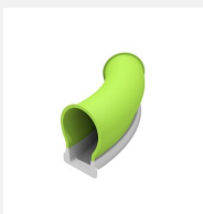
1.10.39.02 Überdeckung zu Kurve rechts 240