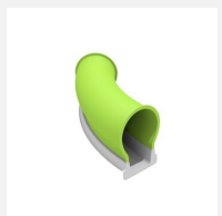
1.10.39.01 Überdeckung zu Kurve links 240 cm