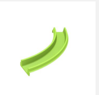
1.10.41.02 Kurve 67.5° rechts, 360 cm