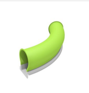
1.10.42.02 Überdeckung zu Kurve rechts 360