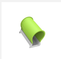
1.10.33.00 Überdeckung zu Mittelstück 120