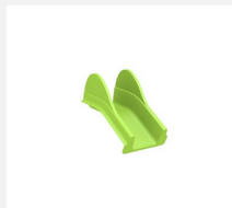
1.10.31.01 Einlauf 100 ohne Überdeckung