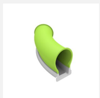
1.10.39.01 Überdeckung zu Kurve links 240 cm