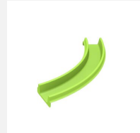
1.10.41.02 Kurve 67.5° rechts, 360 cm