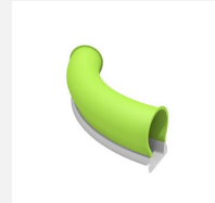
1.10.42.01 Überdeckung zu Kurve links 360 cm