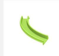
1.10.41.01 Kurve 67.5° links, 360 cm