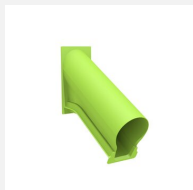
1.10.30.00 Einlauf 180 mit Überdeckung