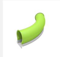
1.10.42.02 Überdeckung zu Kurve rechts 360