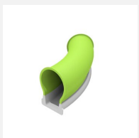
1.10.39.02 Überdeckung zu Kurve rechts 240