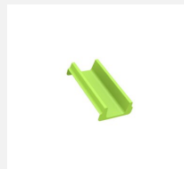
1.10.32.00 Mittelstück gerade 120