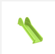
1.10.31.00 Einlauf 180 ohne Überdeckung