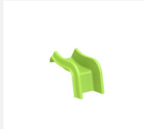
1.10.40.01 Auslauf 100 cm