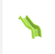
1.10.40.00 Auslauf 180 cm