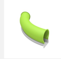
1.10.42.01 Überdeckung zu Kurve links 360 cm