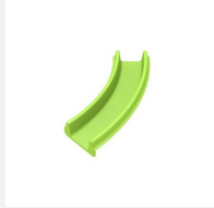
1.10.38.02 Kurve 45° rechts 240 cm