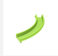
1.10.41.02 Kurve 67.5° rechts, 360 cm