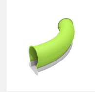
1.10.42.02 Überdeckung zu Kurve rechts 360