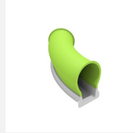
1.10.39.01 Überdeckung zu Kurve links 240 cm