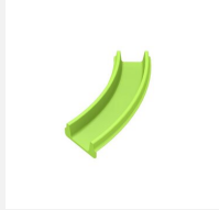
1.10.38.02 Kurve 45° rechts 240 cm