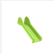
1.10.31.00 Einlauf 180 ohne Überdeckung