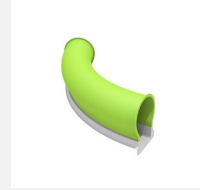
1.10.42.01 Überdeckung zu Kurve links 360 cm