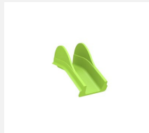
1.10.31.01 Einlauf 100 ohne Überdeckung