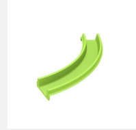
1.10.41.02 Kurve 67.5° rechts, 360 cm