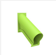
1.10.30.00 Einlauf 180 mit Überdeckung