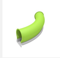
1.10.42.02 Überdeckung zu Kurve rechts 360