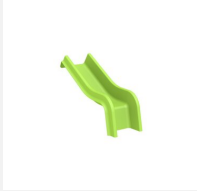
1.10.40.00 Auslauf 180 cm