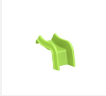
1.10.40.01 Auslauf 100 cm