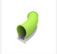
1.10.39.02 Überdeckung zu Kurve rechts 240