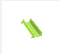
1.10.32.00 Mittelstück gerade 120