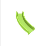
1.10.38.01 Kurve 45° links, 240 cm