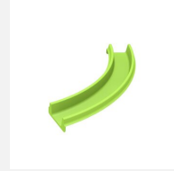
1.10.41.02 Kurve 67.5° rechts, 360 cm