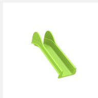
1.10.31.00 Einlauf 180 ohne Überdeckung