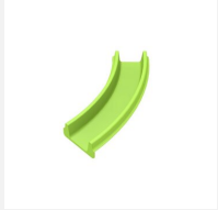
1.10.38.02 Kurve 45° rechts 240 cm