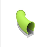
1.10.39.01 Überdeckung zu Kurve links 240 cm