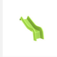
1.10.40.00 Auslauf 180 cm