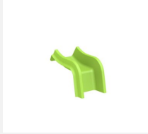
1.10.40.01 Auslauf 100 cm