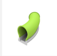
1.10.39.02 Überdeckung zu Kurve rechts 240