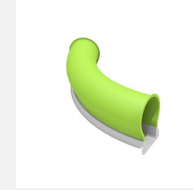
1.10.42.01 Überdeckung zu Kurve links 360 cm