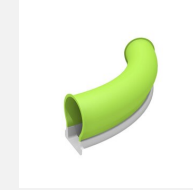
1.10.42.02 Überdeckung zu Kurve rechts 360