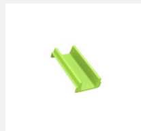
1.10.32.00 Mittelstück gerade 120