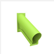
1.10.30.00 Einlauf 180 mit Überdeckung