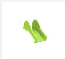
1.10.31.01 Einlauf 100 ohne Überdeckung