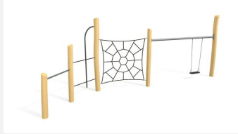
BN.010.8 Spinnennetz 8