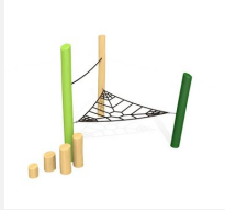
BN.010.5.L Spinnennetz 5 - Netz mit