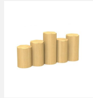
FS.012.20.20 Randabschluss Holzpalisaden 20-