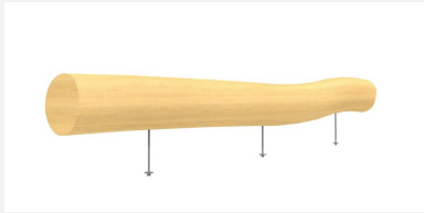
FS.012.18.25 Naturholz Randabschluss 25-30 cm, per lfm