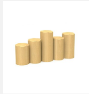
FS.012.20.16 Randabschluss Holzpalisaden 16-