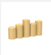
FS.012.20.20 Randabschluss Holzpalisaden 20-