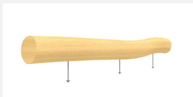
FS.012.18.25 Naturholz Randabschluss 25-30 cm, per lfm