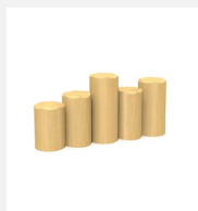
FS.012.20.25 Randabschluss Holzpalisaden 25-